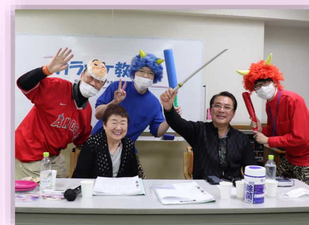
カラオケ教室開催中にもお邪魔しました。